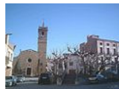
Foto És un edifici barroc que data de l'any 1783. El seu autor fou Güell de Poblet. La façana es caracteritza per una portalada emmarcada per pilastres sobre grans sòcols i al damunt una rosassa. El campanar és de planta quadrada amb quatre obertures a la part superior. L'interior fou pintat pel barceloní Jesús Massana. Aquest temple és modern però hi ha llocs del campanar on s'aprecien elements de l'antiga església romànica. Horari al públic: de dilluns a diumenge, de 9 a 18 h.